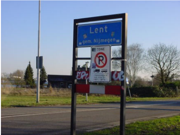
Griftdijk (Nijmegen), 01-02-2025