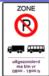
H2 - H1 - zone E201 met onderbord