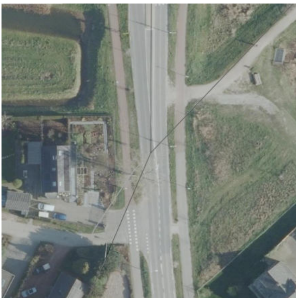
BAG woonplaats | CBS buurten | Luchtfoto - PDOK

De borden staan aan de linker kant van de weg. Aan de rechterkant staat aan de lantaarnpaal alleen zone E201 met onderbord.