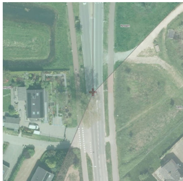
Luchtfoto 2024 | Wijken - KaartViewer