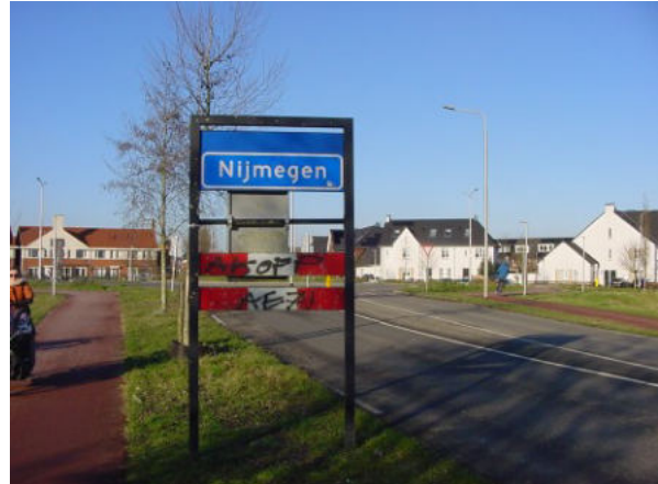
Griftdijk Noord (Lent), 01-02-2025